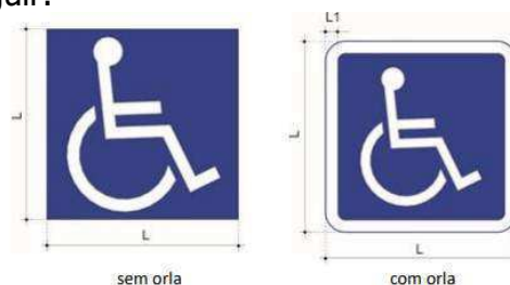
Quadro 1 – Características do Símbolo Internacional de Acesso (SAI)